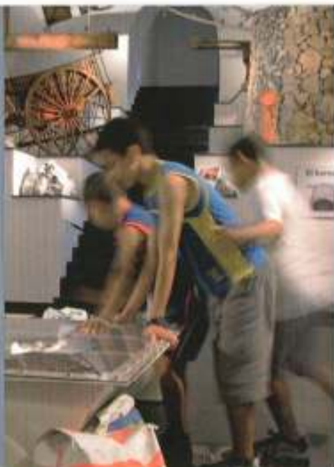
Bóveda terminada en yeso. Entussa d'Algeps.