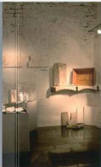
Sala de Audiovisuales. Sala d'Audiovisuals.